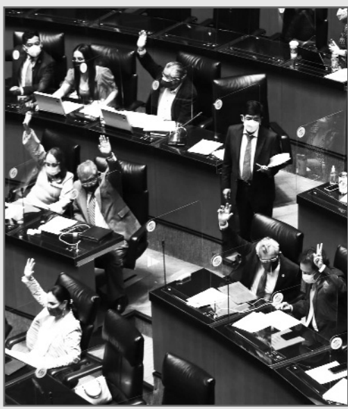
Varios legisladores se reservaron algunos artículos del dictamen.